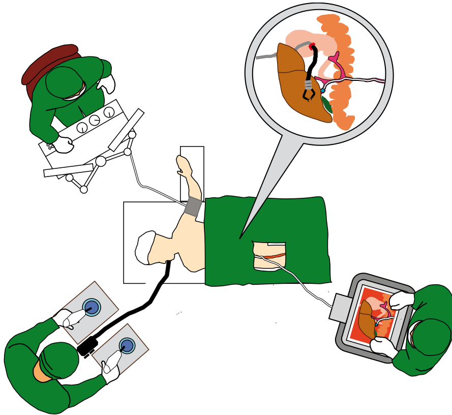
Abb. 2: Schematische Darstellung eines kombinierten mikroinvasiven und transvaskulären Eingriffs.

einer weiteren 2D-Projektion zu vermeiden, soll in diesem Zusammenhang eine 3D-Darstellung über einen autostereoskopischen Monitor dem Chirurgen zur Verfügung gestellt werden.